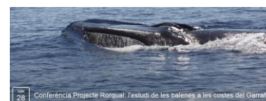
28 Conferència Projecte Rorqual: l'estudi de les balenes a les costes del Garraf

http://www.collsmiralpeix.cat/ca/agenda/conferencia_projecte_rorqual_estudi_de_les_balenes_a_les_costes_del_garraf/57/ VIDEO http://www.collsmiralpeix.cat/ca/galeria-videos/