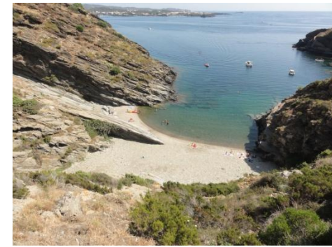
Platja Sabolla. Cadaqués