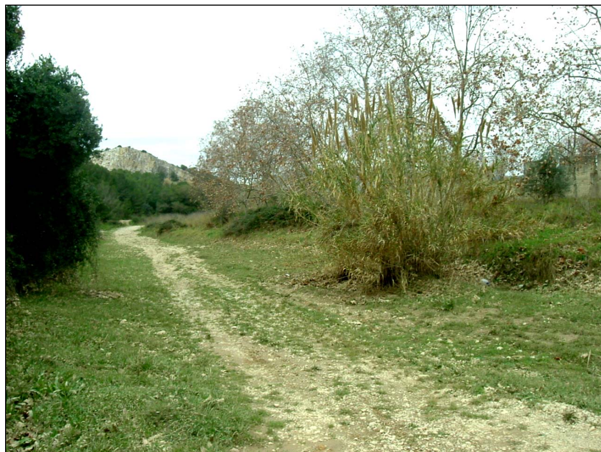
Llera de la riera de Ribes

Malgrat l'estat d'alteració que presenta la riera cal destacar la funció clau com a eix vertebrador de la connectivitat entre el front litoral i els espais forestals de l'interior del Garraf.