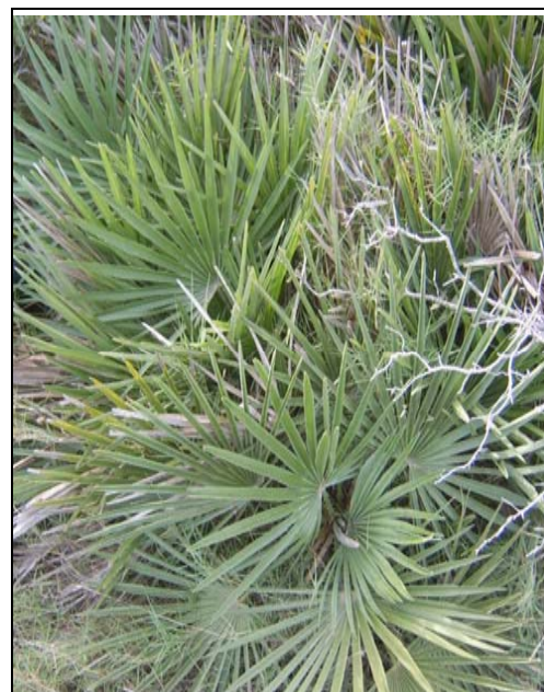
Fotografia 2. Margalló ( Chamaerops humilis ) fruticosi )

Es per això que es proposa realitzar una inventari detallat de les diferents espècies de flora i fauna d'interès, per tal de valorar el seu estat actual i proposar les mesures adients per la preservació, conservació i recuperació d'aquestes comunitats, i per tant d'aquestes espècies.