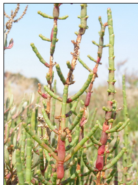
Fotografia 3. Cirialera ( Arthrocnemum fruticosum )