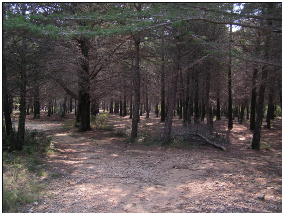
Fotografia 1. Repoblació de pi blanc sense sotabosc de màquia

A l'àmbit de Els Colls i Miralpeix es localitzen diferents punts amb elevada sobrefreqüentació que acaben provocant la degradació completa de l'espai. En aquest cas en concret, es proposen una sèrie d'actuacions per tal de recuperar les repoblacions de pinedes, fent compatible la preservació de l'espai natural amb els usos de lleure.