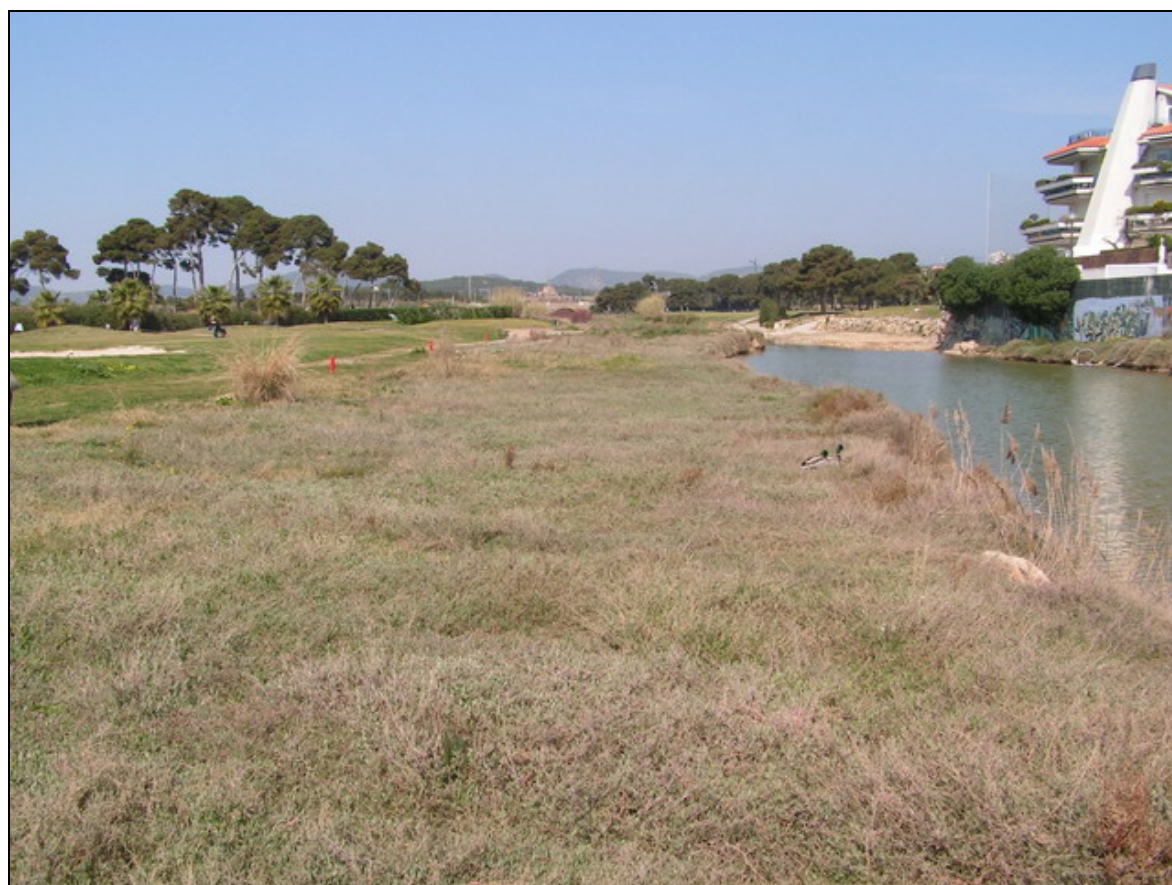
Desembocadura de la riera de Ribes

Aquest espai es troba inclòs a l'Inventari de zones humides de Catalunya.